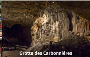
Grotte des Carbonnières