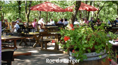
Roc du Berger