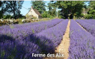
Ferme des Alix