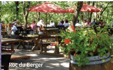
Roc du Berger