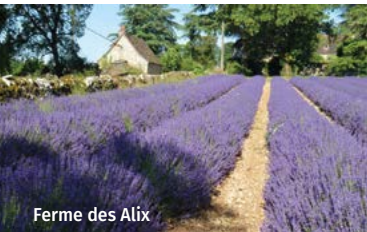
Ferme des Alix