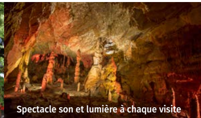
Spectacle son et lumière à chaque visite