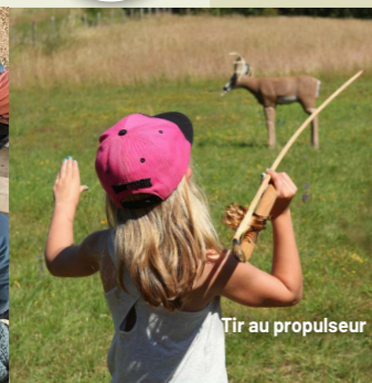
Tir au propulseur