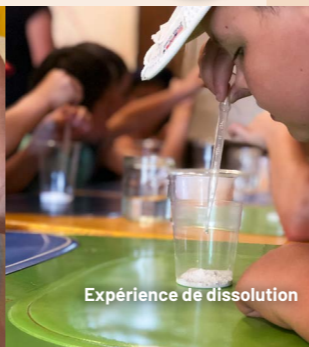
Expérience de dissolution