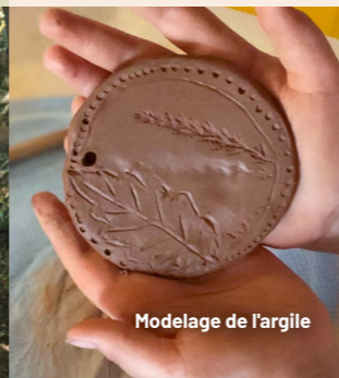
Modelage de l'argile