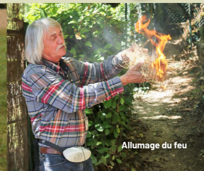
Allumage du feu