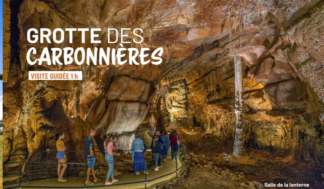
Salle de la lanterne